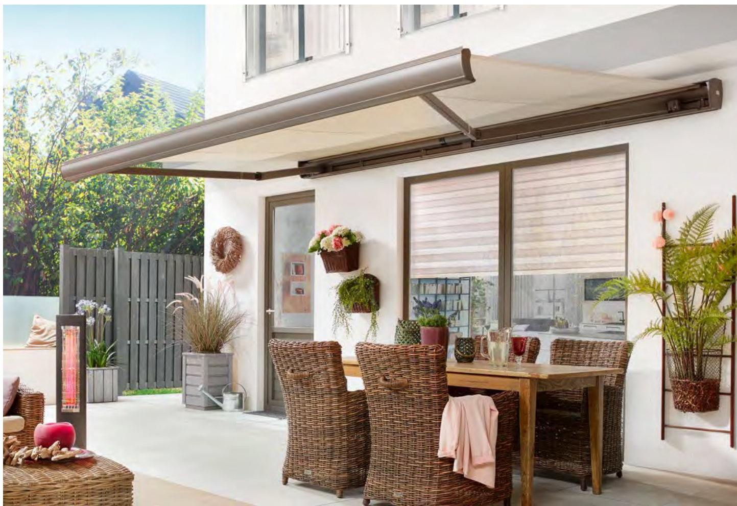
Kompaktes Design mit hohem Komfort und hervorragender Technik.

Klassisches Design, überlegene Qualität, einfache Bedienbarkeit und solide Wertbeständigkeit: Die Family Compact vereint die Schutzfunktion einer Kassettenmarkise mit dem Montagekomfort einer Tragrohr-Markise.